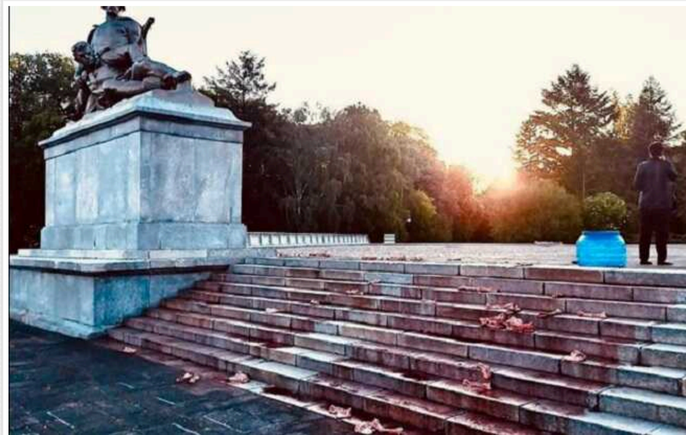
У Польщі біля пам'ятника радянським солдатам розлили кров і розклали кістки

Посол Росії традиційно 9 травня покладає квіти до пам'ятника радянським солдатам як символу перемоги над фашизмом.