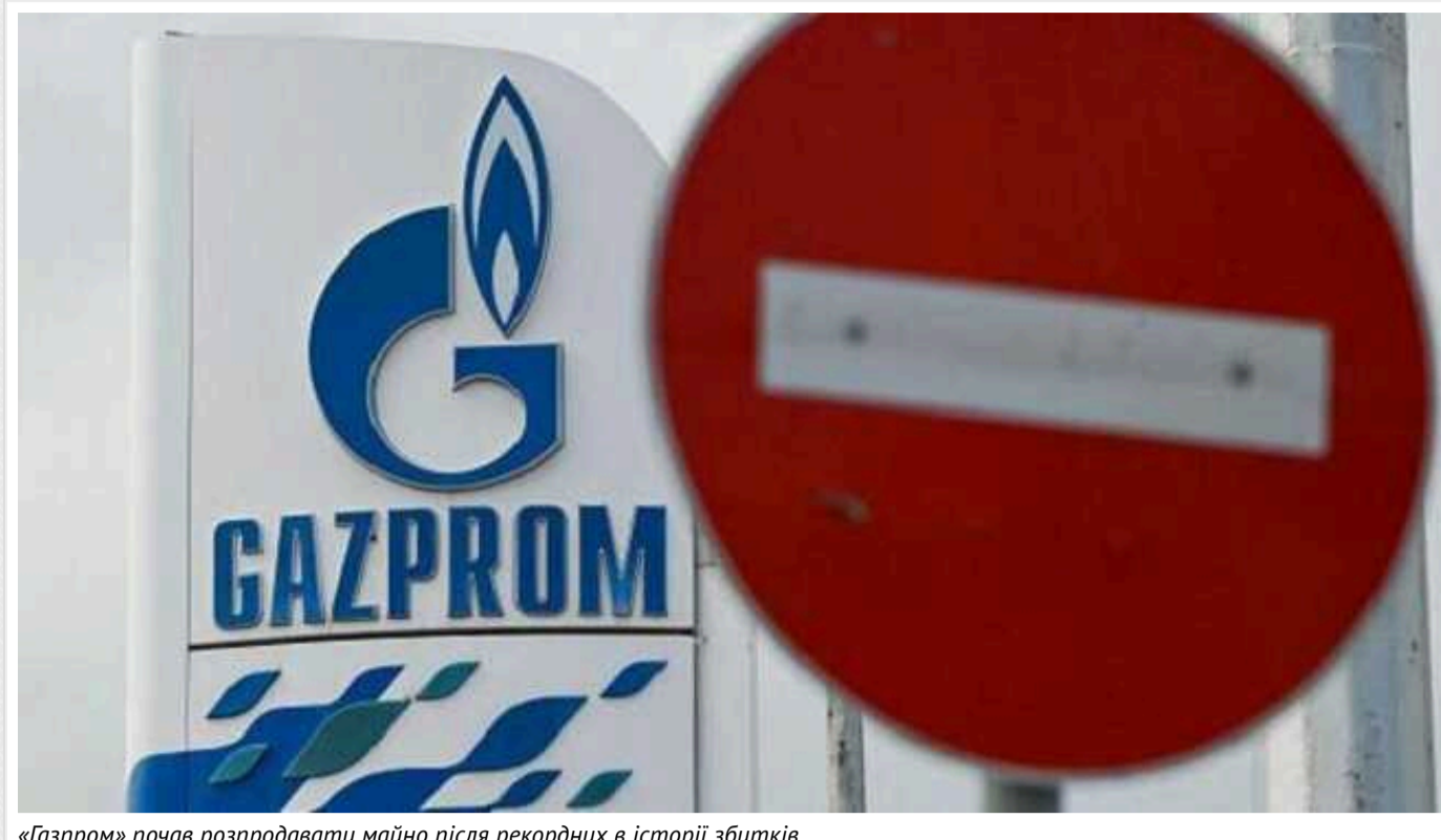
«Газпром» почав розпродавати майно після рекордних в історії збитків

Рішення ухвалено нібито "з урахуванням завершення переїзду компаній групи "Газпром" у Санкт-Петербург".