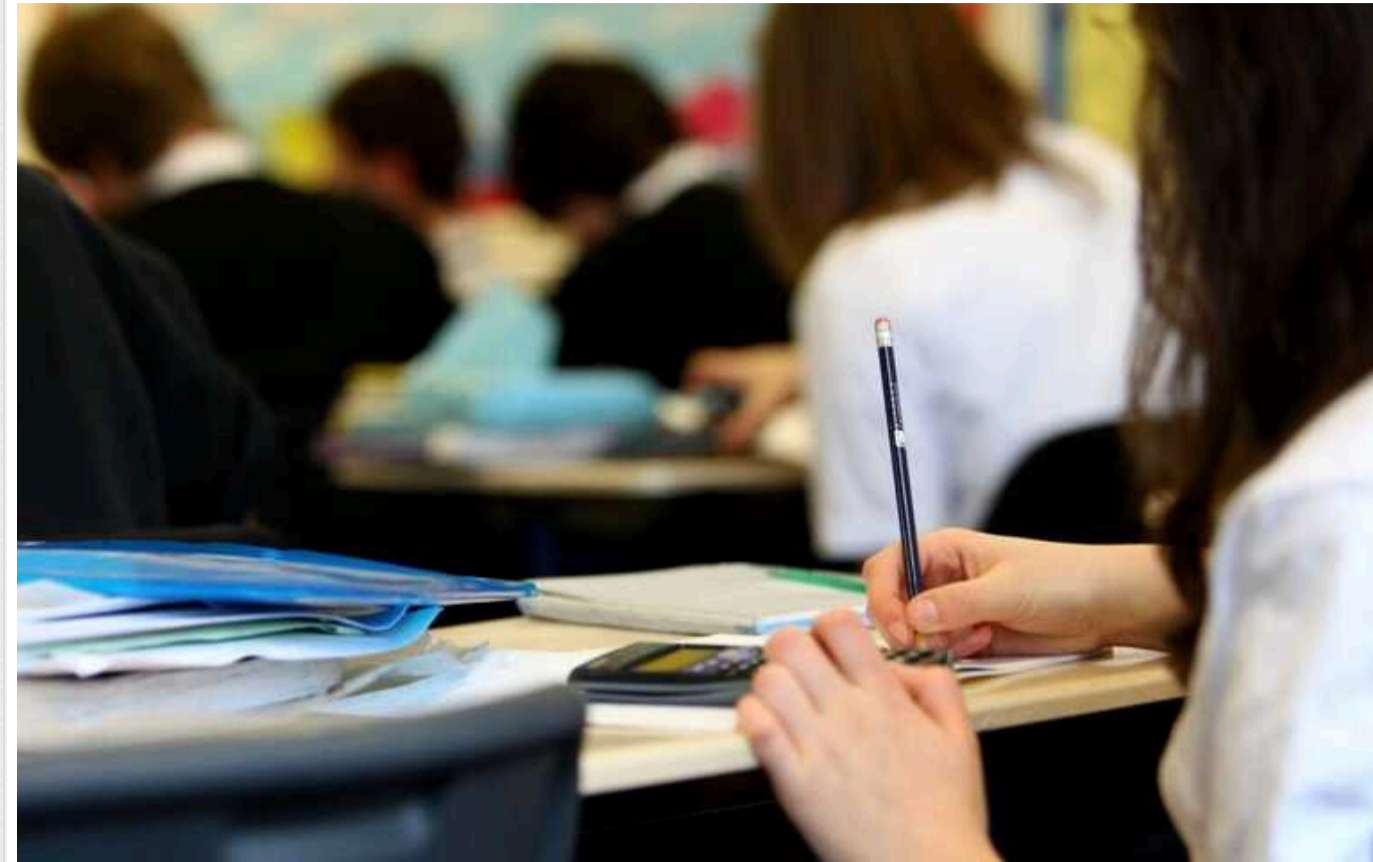
У РФ студентів відраховують за відмову працювати на оборонних заводах, – ЦНС

Студентів Балтійського державного технічного університету "Военмех", направляють на військові підприємства на навчальну практику. У разі відмови – відраховують з вишу.