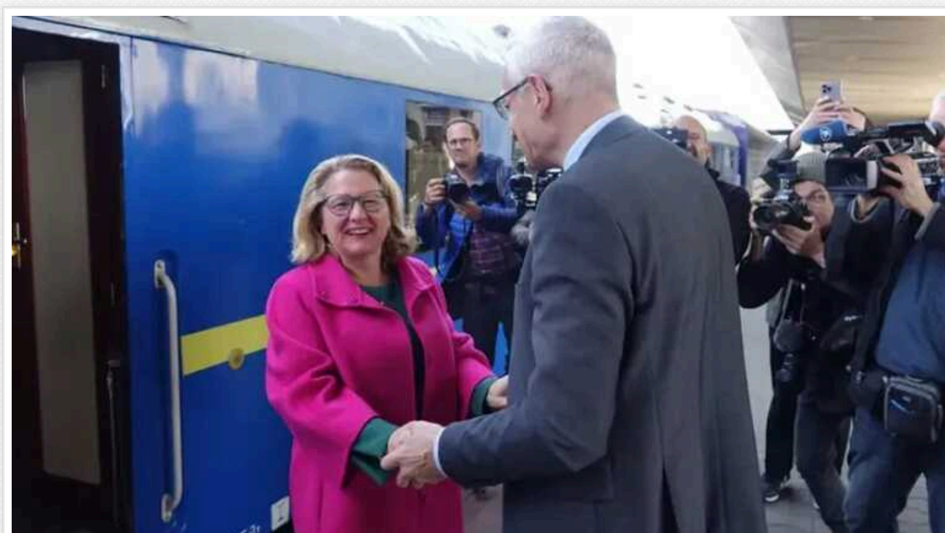
Міністерка розвитку Німеччини Свеня Шульце прибула з візитом до Києва

До Києва вранці 9 травня приїхала федеральна міністерка розвитку й економічного співробітництва ФРН Свеня Шульце. Представниця Соціал-демократичної партії Німеччини прибула до української столиці потягом УЗ.