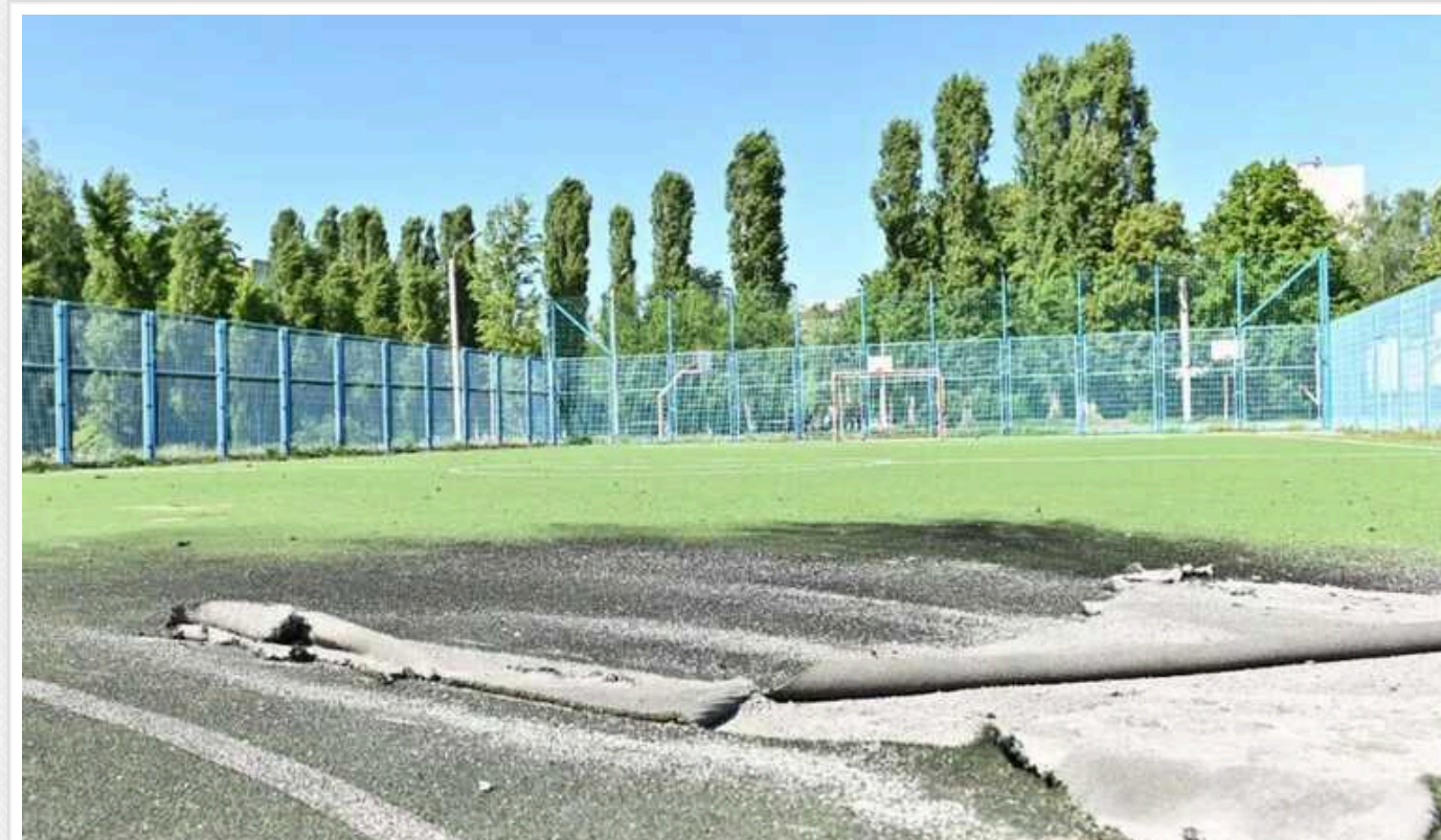
В Мережі з'явилися дані про стан дітей, які постраждали внаслідок удару окупантів по Харкову

У Харкові четверо дітей, які постраждали в результаті удару по шкільному стадіоні, перебувають у важкому стані. Діти не встигли сховатися від ворожого снаряду, оскільки вибух пролунав до сигналу повітряної тривоги.