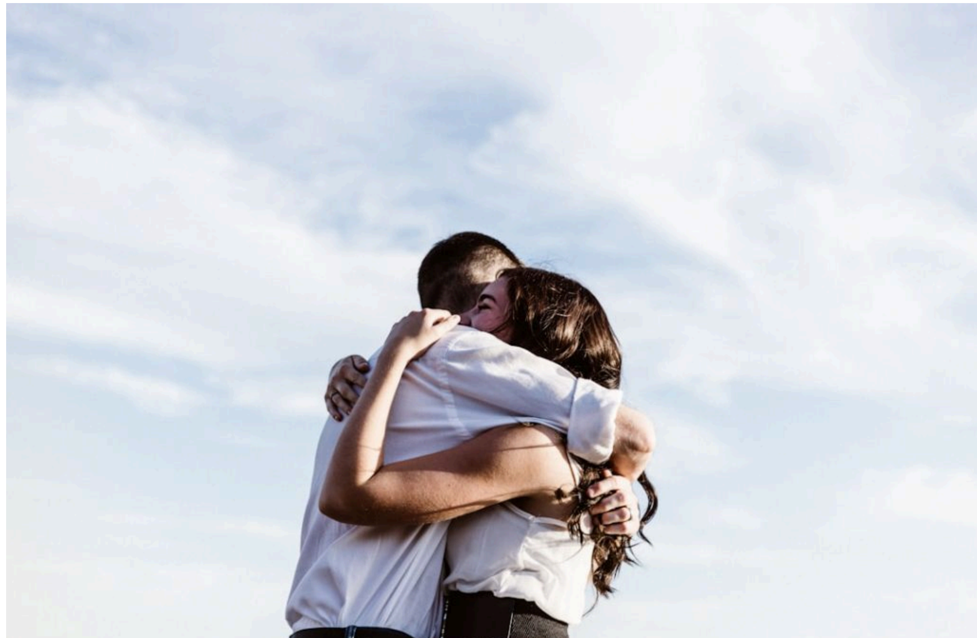
Психологія / © unsplash.com

ОЛЬГА СТЕПАНОВА — 25 Травня 2026, 18:53 1 Min Read — ПСИХОЛОГІЯ І СТОСУНКИ