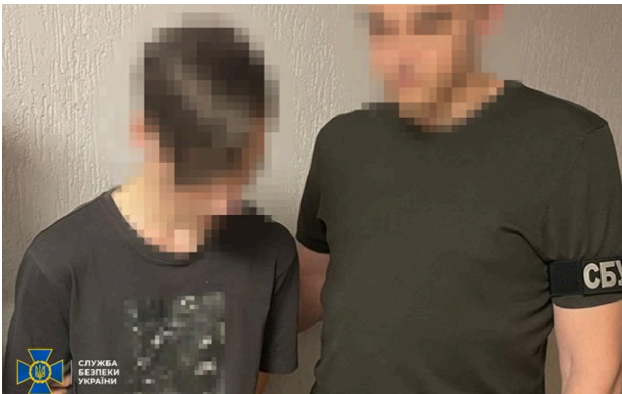
Замовлення ворога виконував 18-річний киянин

Фігуранта затримали наступного дня після кривавого обстрілу столиці, коли він проводив дорозвідку поблизу об'єкта Міноборони та з'ясував наслідки ворожих прильотів.