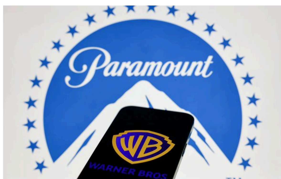
АМКУ схвалив угоду між Paramount та Warner Bros