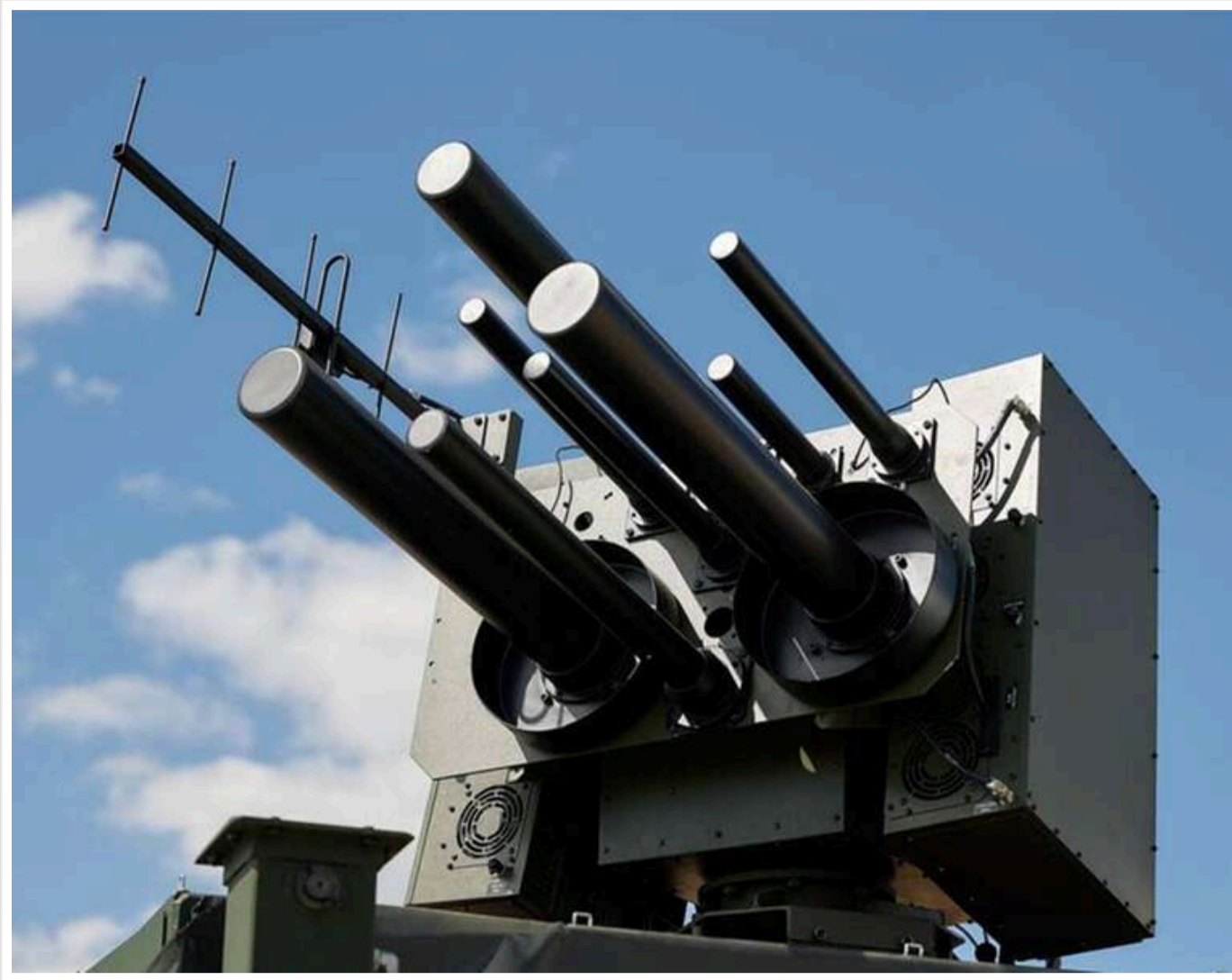
Україна масштабує використання систем РЕБ Lima для захисту від російських ракет та БПЛА, - Politico

На тлі браку дорогих західних ракет для ППО Україна дедалі більше покладається на новітні системи радіоелектронної боротьби.