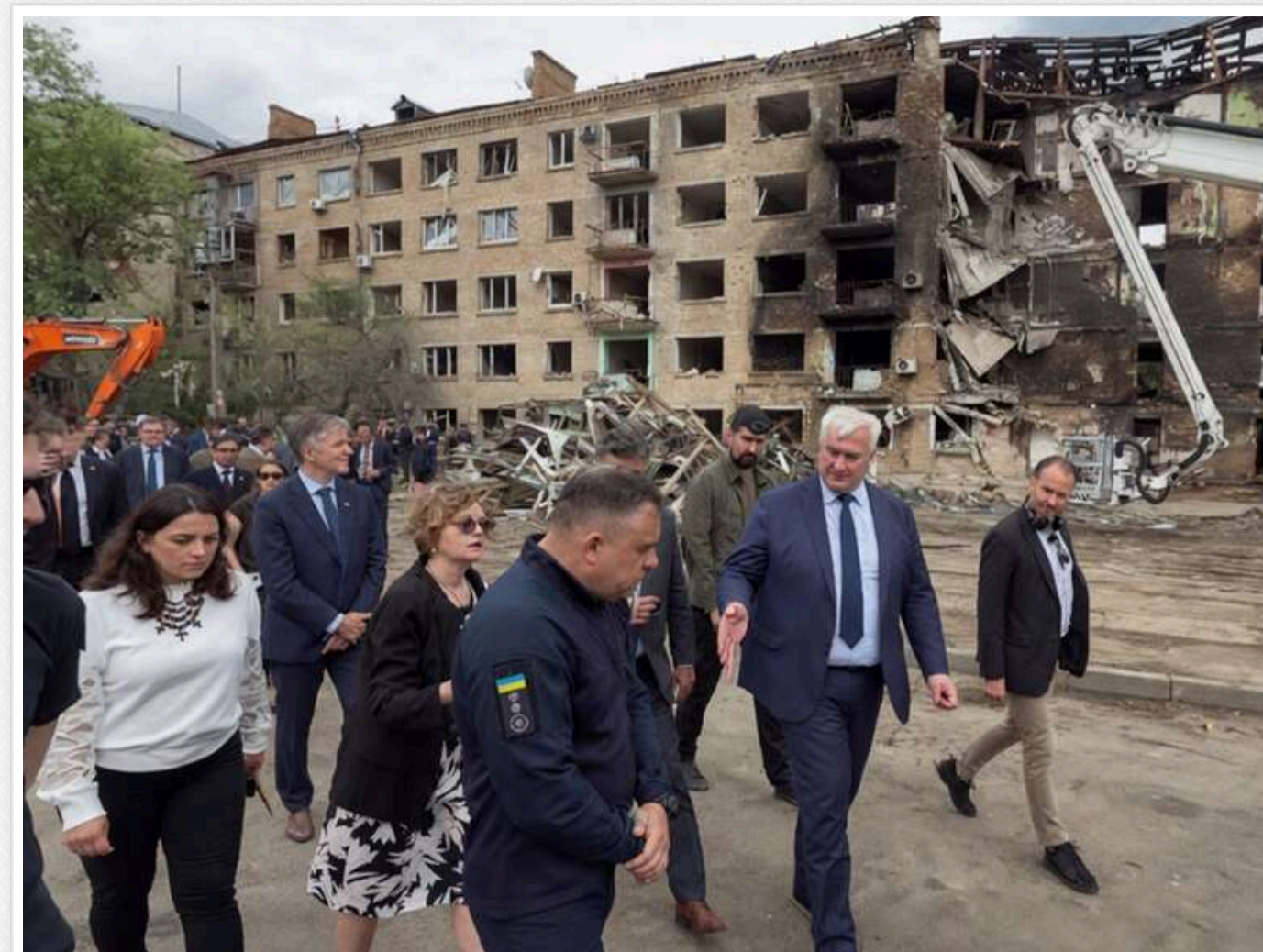
Голова МЗС Андрій Сибіга та представники понад 70 іноземних дипмісій відвідали місця обстрілів у Києві

Міністр закордонних справ Андрій Сибіга разом із представниками понад 70 іноземних дипломатичних місій відвідав місця російських ударів у Києві та поклав квіти на вшанування пам'яті загиблих.