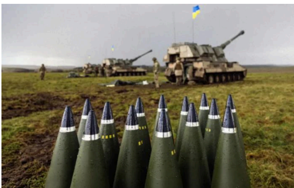
Завершено найбільшу закупівлю далекобійних снарядів

АОЗ ДОТ законtrakтував найбільшу в історії партію 155-мм далекобійних снарядів - на фронт їх приїде на десятки тисяч більше, ніж очікувалося.