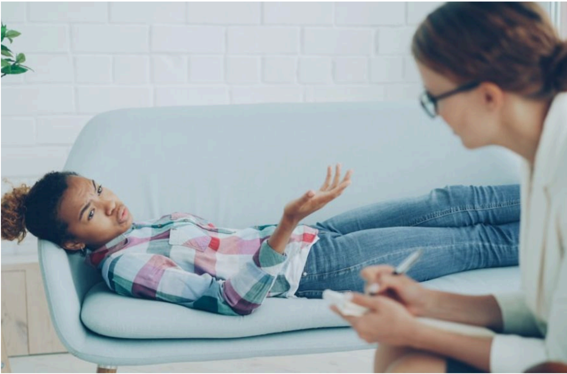
Діти / © unsplash.com

ОЛЬГА СТЕПАНОВА — 25 Травня 2026, 14:46 2 Mins Read — ПСИХОЛОГІЯ І СТОСУНКИ