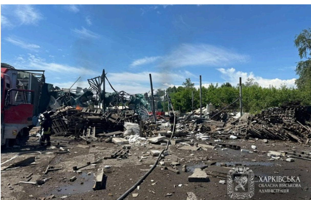
Росіяни вдарили по Дергачах

Госпіталізували 17 людей із вибуховими пораненнями: 15 чоловіків та двох жінок. Троє постраждалих чоловіків перебувають у важкому стані.