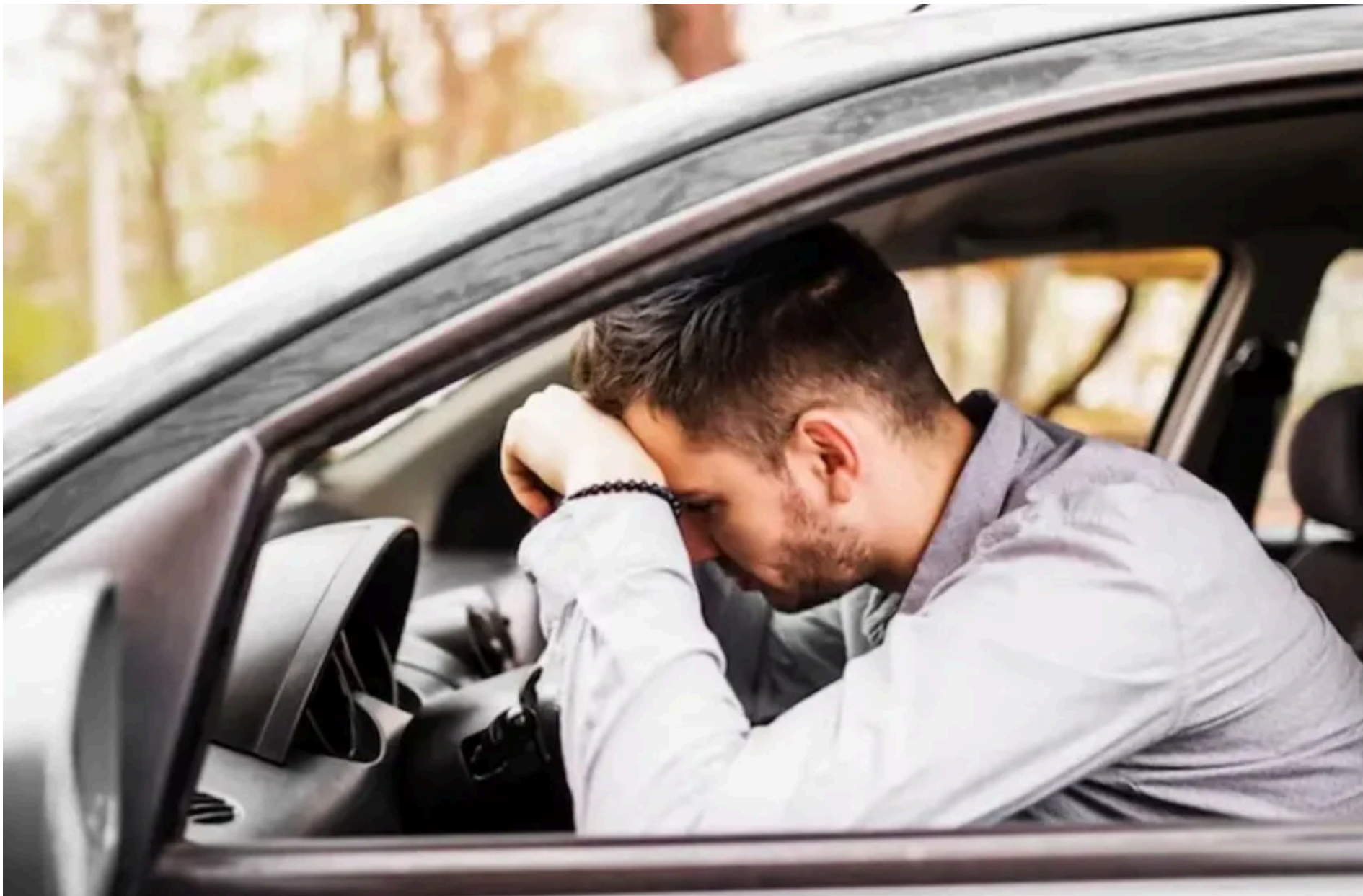
Водії / Фото з відкритих джерел

ДМИТРУК АНДРІЙ — 25 Травня 2026, 10:12 1 Min Read — АВТО