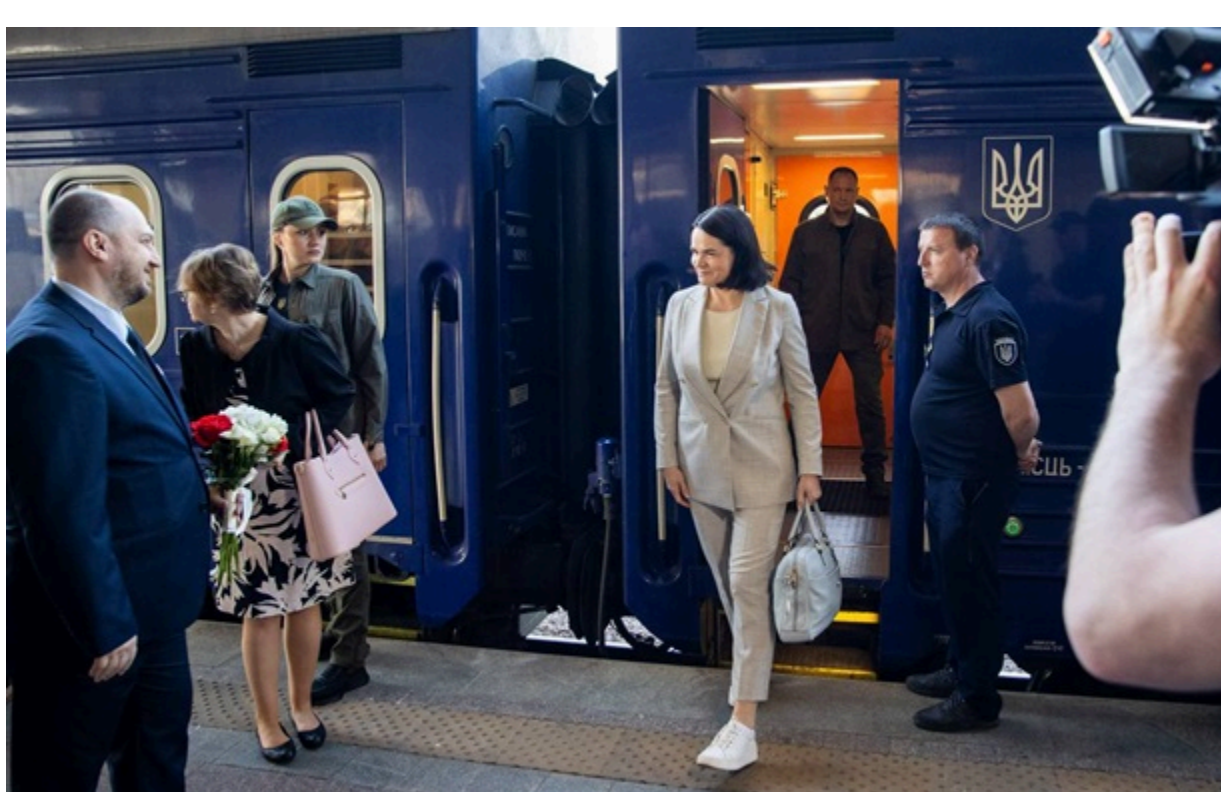
Світлана Тихановська прибула в Київ