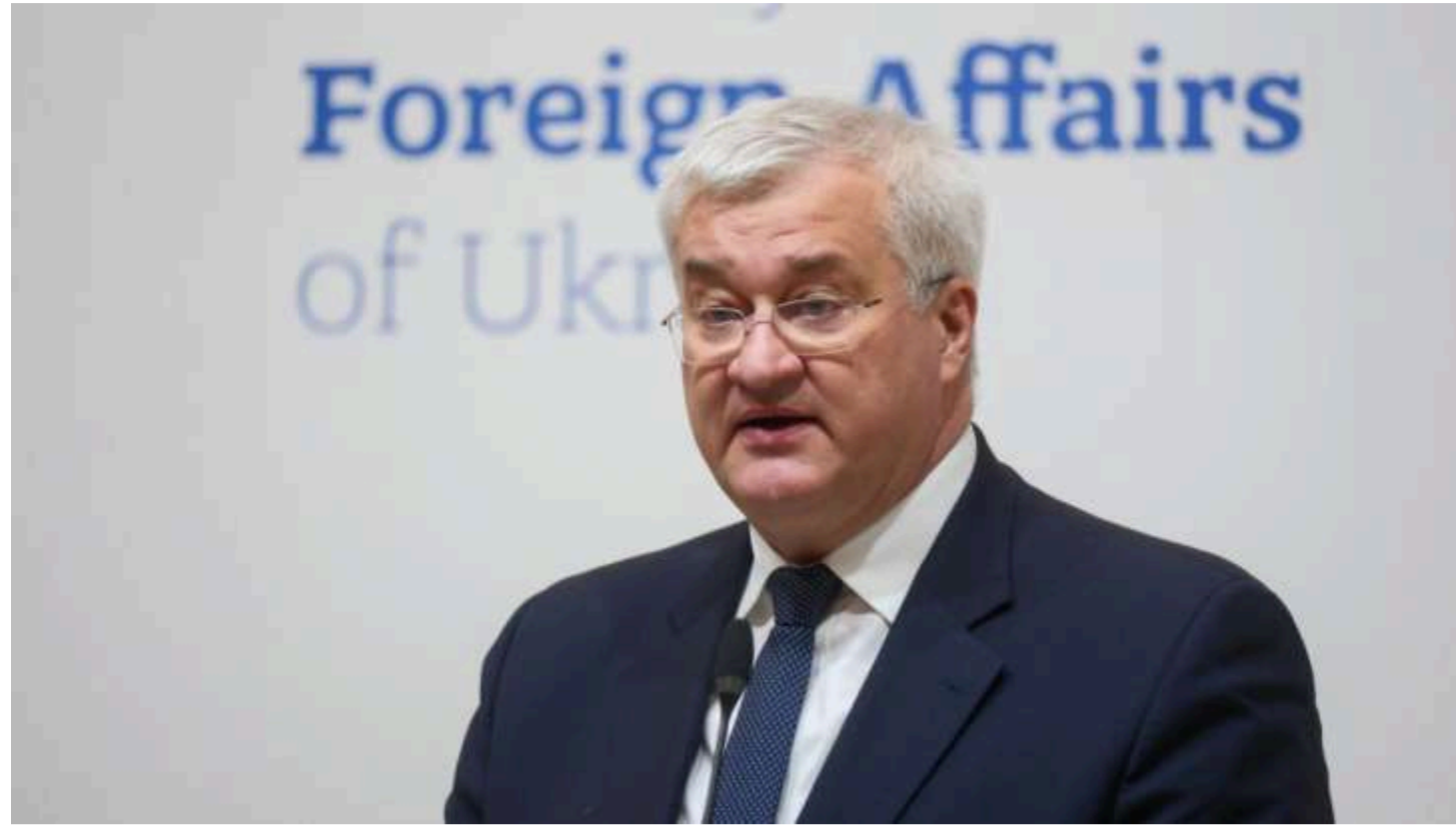
Андрій Сибіга/Ілюстративне фото з відкритих джерел

Україна після масованої атаки Росії в ніч на 24 травня вимагає скликання термінового засідання Ради Безпеки ООН та спільного засідання Форуму ОБСЄ з питань безпекового співробітництва і Постійної ради ОБСЄ. Про це повідомив міністр закордонних справ Андрій Сибіга у соцмережі X.