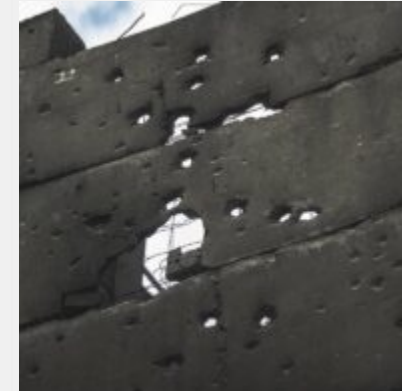
Як виглядає українська ТЕЦ, що пережила не одну ракетну атаку російських загарбників