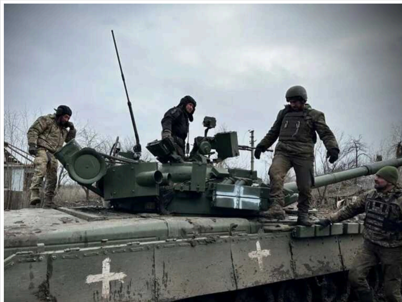
У ЗСУ розповіли про ситуацію на Авдіївському напрямку: противник повернувся до тактики «м'ясних штурмів»

На Авдіївському напрямку війська РФ повернулися до тактики "м'ясних штурмів". Сили оборони України активно ліквідовують там як живу силу ворога, так і його бронетехніку, зокрема й сучасні танки Т-90.