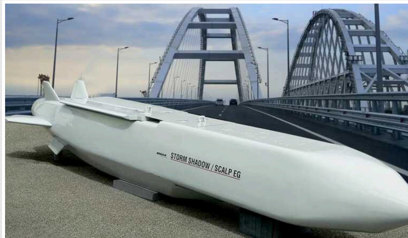
Аналітик розкрив переваги АТАСМС над Storm Shadow: Крим стане «болючим» місцем росіян

Раніше Україна завдавала ударів по окупантах у Криму британськими Storm Shadows. Але все змінила нова американська допомога.