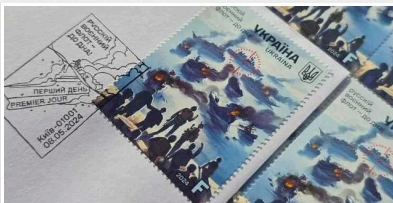
У Києві презентували нову поштову марку: «Русській воєнний флот – до дна!»

На нових марках зображено найвагоміші втрати ворога на морі за два роки повномасштабної війни. Є навіть "Адмірал Макаров", але він поки що лише під прицілом.