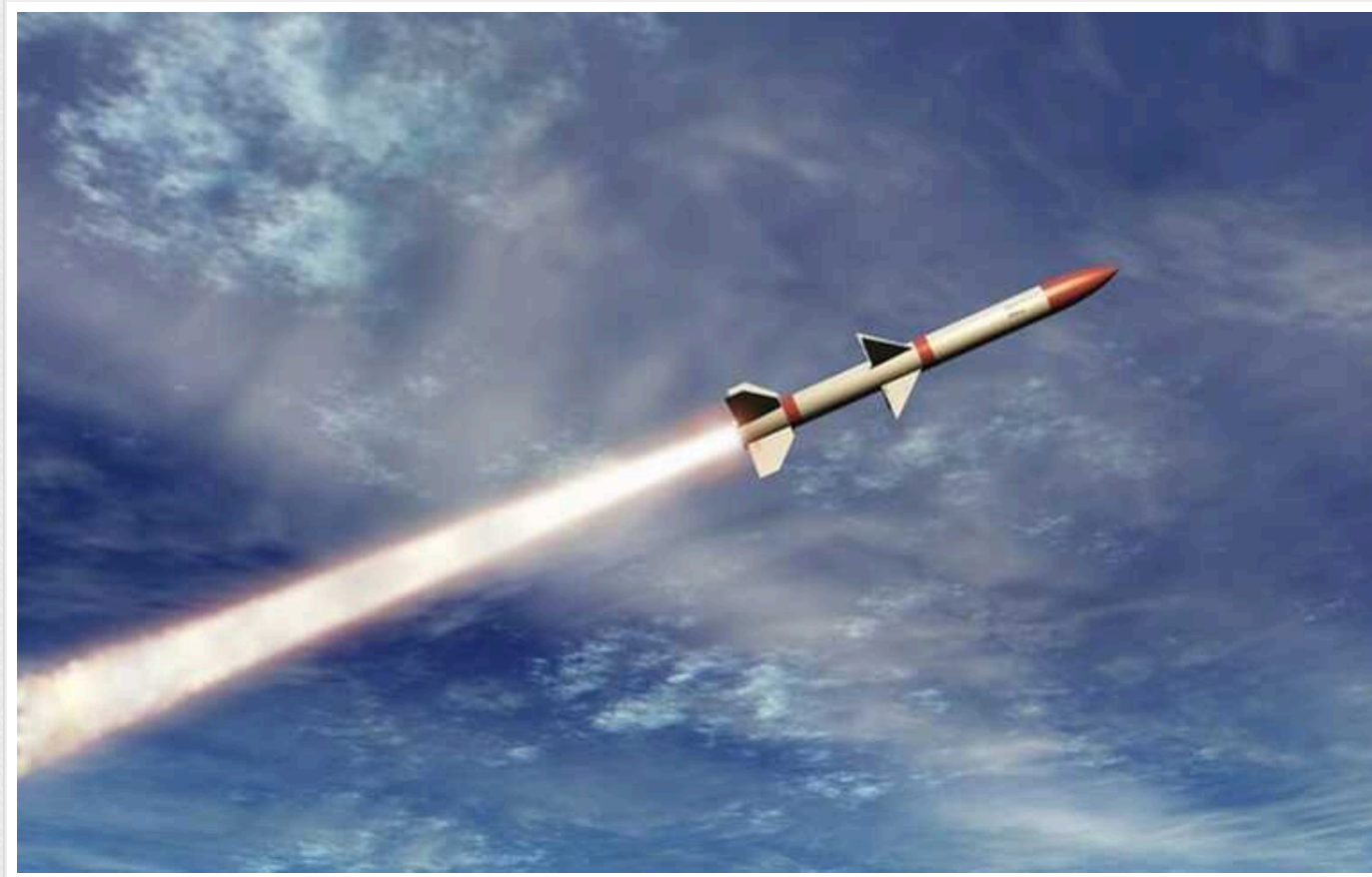
В ISW пояснили, чому Росія активізувала удари по українській енергосистемі

У ніч на 8 травня Росія завдала великомасштабних ракетних і дронівих ударів по енергетичній інфраструктурі України, що стало п'ятою такою атакою з 22 березня 2024 року. Вона вдалася до неї, продовжуючи використовувати деградовану систему української протиповітряної оборони напередодні прибуття західної допомоги.