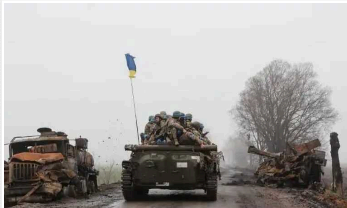
Генерал НАТО назвав "найголовнішу" умову для перемоги України у війні

Адмірал Роб Бауер заявив, що у світі буде "дуже неспокійно" ще 15 років. Успіхи ЗС РФ він описав як досі не стратегічні.