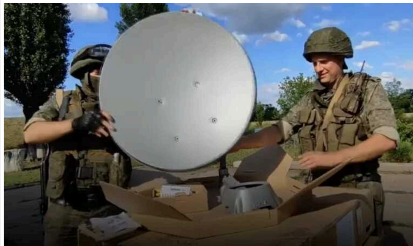
Супутникові системи які вироблені в Україні везуть в Росію для окупантів, – розслідування

Лише за минулий рік у Росію поставили цього обладнання на приблизно 5 мільйонів доларів. Системи Gilat SkyEdge завозять у Росію через інші країни, але у митних документах вказане їх українське походження.