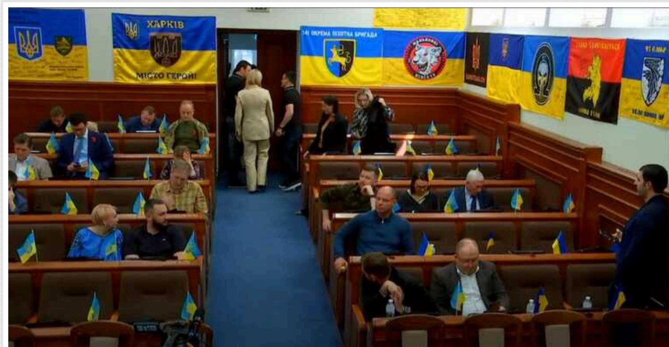
Депутати від "Слуги народу" залишили залу під час голосування за присвоєння звання "Почесний громадянин Києва" Залужному та Костенко

Депутати фракції «Слуга народу» у Київській міській раді у повному складі залишили сесійну залу під час голосування за присвоєння звання «Почесний громадянин Києва» колишньому головнокомандувачу ЗСУ Валерію Залужному та поетесі Ліні Костенко.