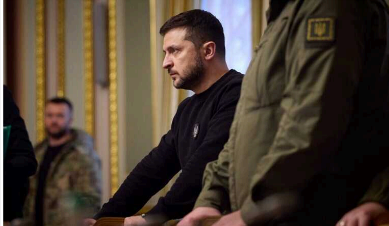
Зеленський заслухав доповіді Сирського та Умерова щодо ситуації на фронті

Міністр оборони України Рустем Умеров та головнокомандувач ЗСУ Олександр Сирський доповіли президенту Володимирі Зеленському про ситуацію на фронті.