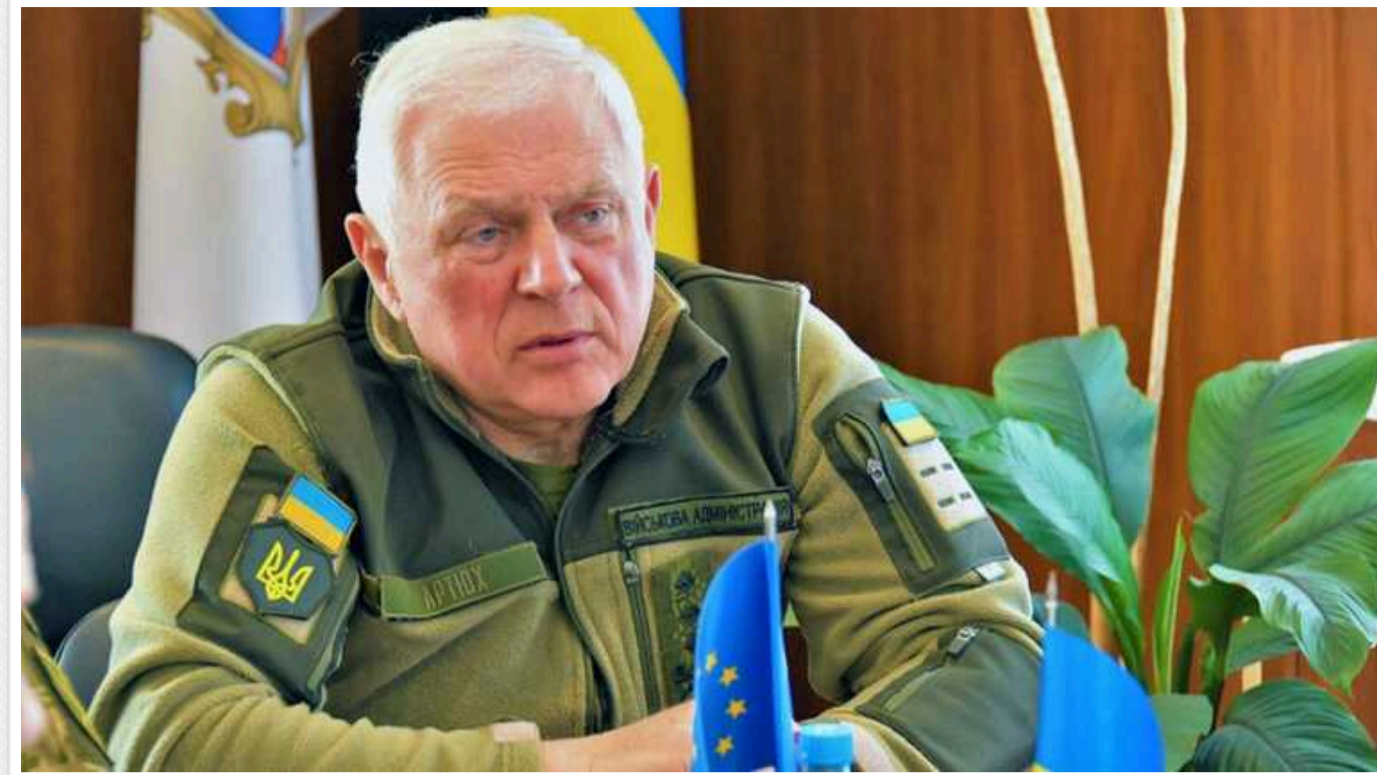
РФ намагається зірвати мобілізацію на Сумщині через спеціальні Telegram-канали, залучаючи українську молодь, — ОВА

Рада оборони звернулася до жителів Сумської області з проханням звернути увагу на те, які інтернет-ресурси відвідують їхні діти.