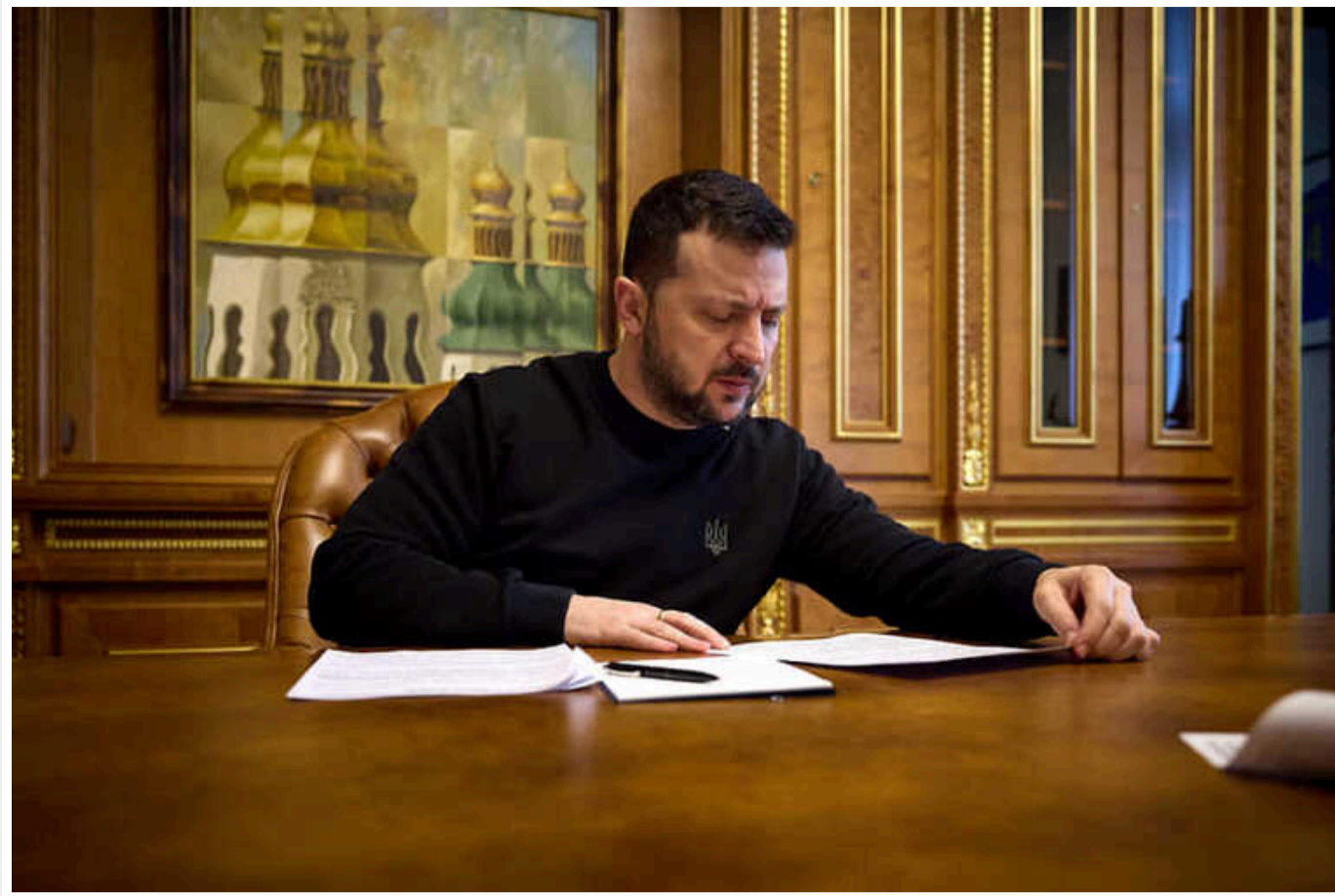
Зеленський підписав укази щодо призначення 116 суддів

Президент Володимир Зеленський підписав укази про призначення 116 суддів на посади суддів місцевих судів.