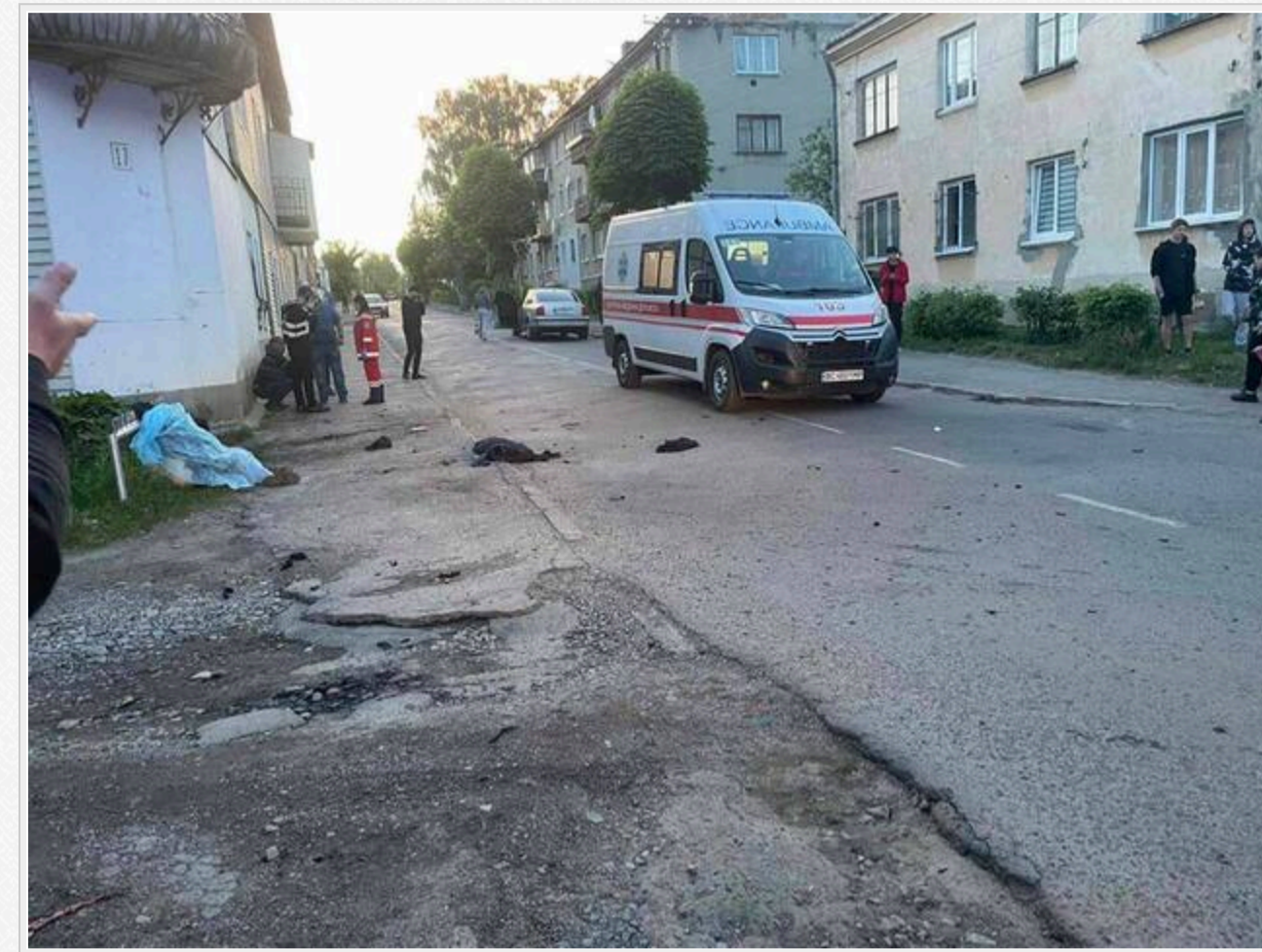
Фото та відео 18+

Причини вчинення таких дій наразі не відомі.