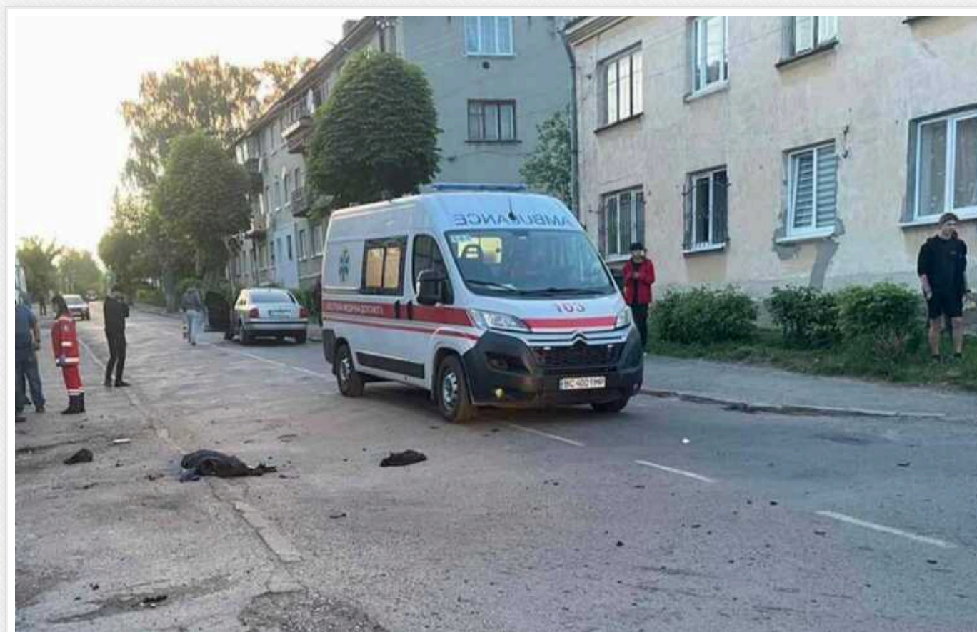
На Львівщині 25-річний хлопець підірвав гранату в руках