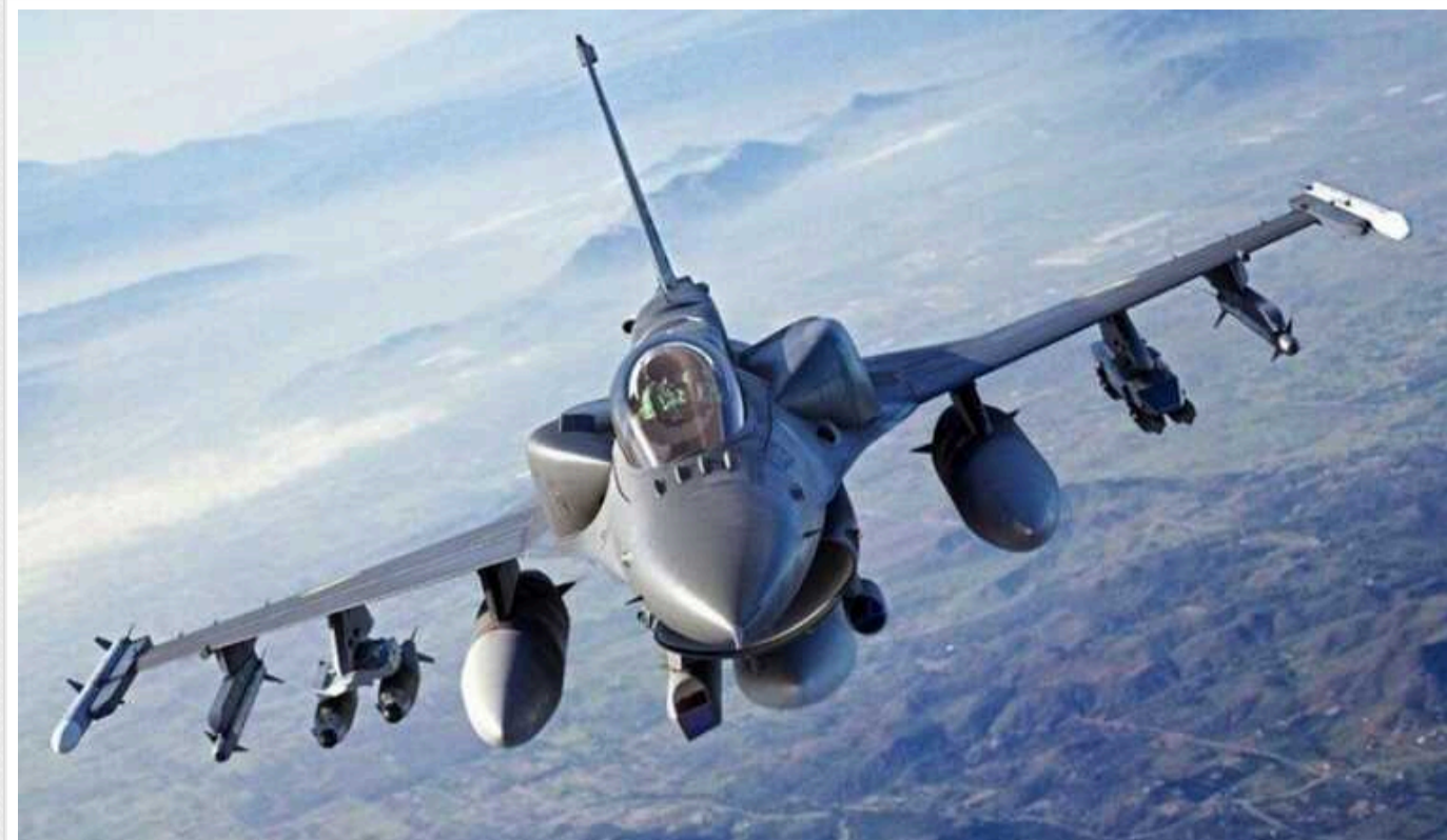
Зеленський обговорив із прем'єркою Данії прискорення передачі Україні винищувачів F-16

Україна чекає на надходження винищувачів F-16 від західних партнерів. Про це президент Володимир Зеленський у середу, 8 травня, поговорив із прем'єр-міністеркою Данії Метте Фредеріксен.