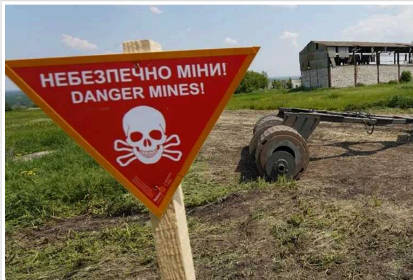
На деокупованій території жінка крала попереджувальні знаки "Міни"

На деокупованій території рятувальники Держслужби з надзвичайних ситуацій зафіксували факт крадіжки попереджувальних знаків "Обережно, міни". Їх вкрала літня жінка, ймовірно, щоб використати стовпчики знаків у господарстві.