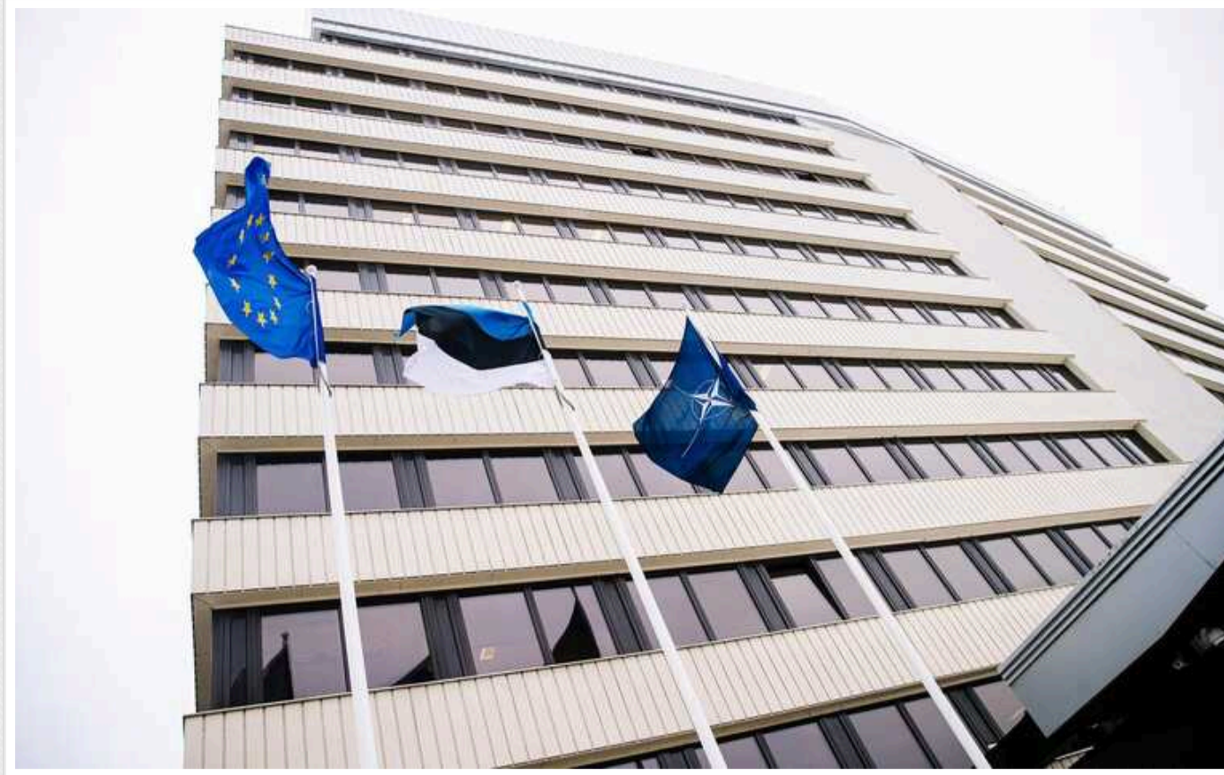
МЗС Естонії викликало російського представника через ситуацію зі збоєм GPS у регіоні

Міністерство закордонних справ Естонії викликало повіреного у справах Росії у зв'язку з регулярними перебоями в роботі сигналу GPS.