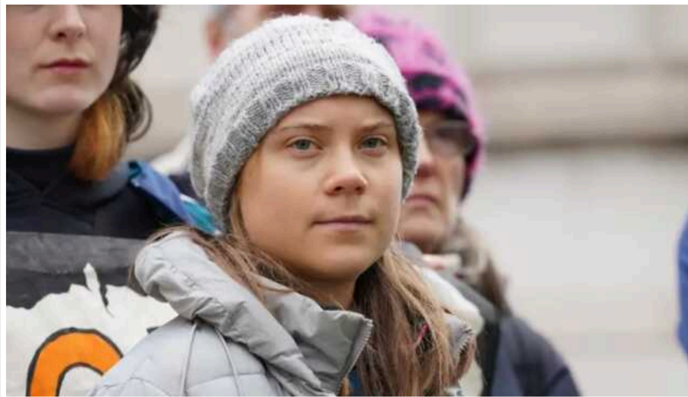
Суд утретє оштрафував Грету Тунберг через блокування шведського парламенту

Стокгольмський окружний суд 8 травня визнав кліматичну активістку Грету Тунберг винною за двома пунктами звинувачення у непокорі громадському порядку через акції протесту біля парламенту, що відбулися в березні цього року.