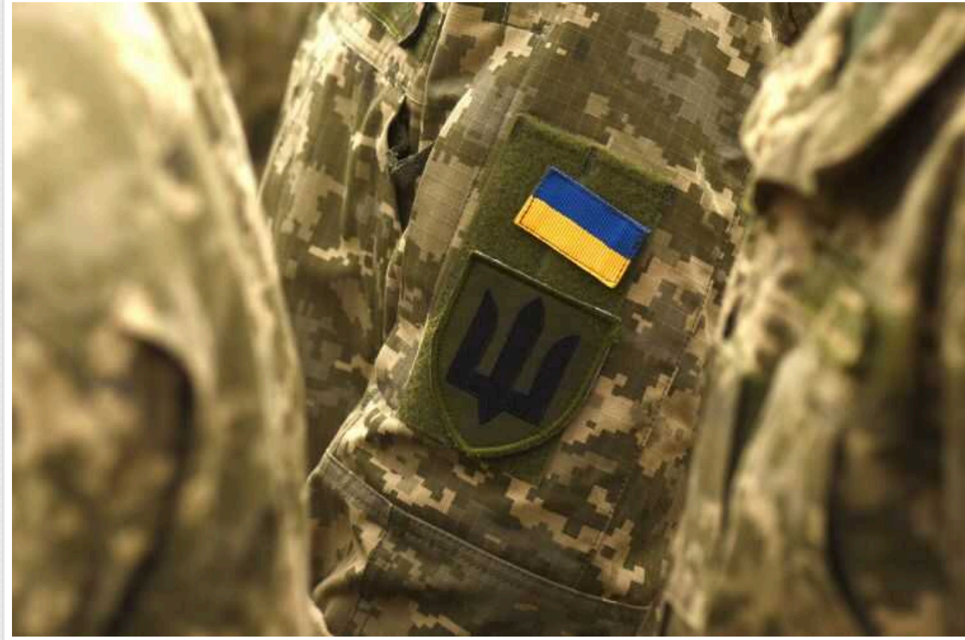
Після початку війни українська влада посилила тиск на журналістів-розслідувачів, — Politico

Юрій Ніколов, редактор проекту «Наші Гроші», в інтерв'ю Politico розповів, що залякування українських журналістів-розслідувачів лише посилюється — попри січневу заяву Володимира Зеленського про те, що «будь-який тиск на журналістів є неприйнятним».