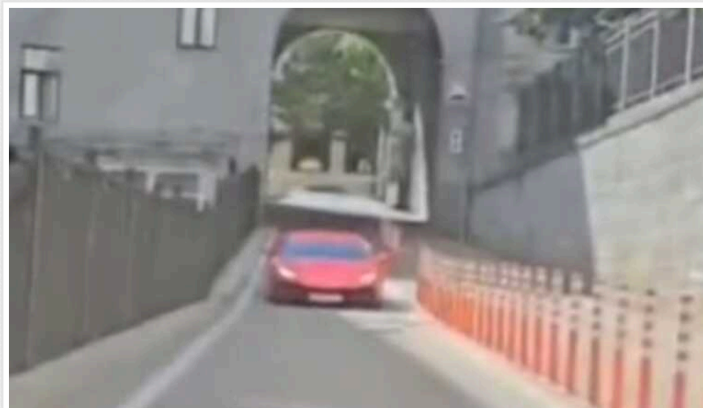
У внутрішньому дворі КМДА чоловік на Porsche зняв новенький Lamborghini

Відбулося це сьогодні, у той день, коли було засідання Київської міської ради.