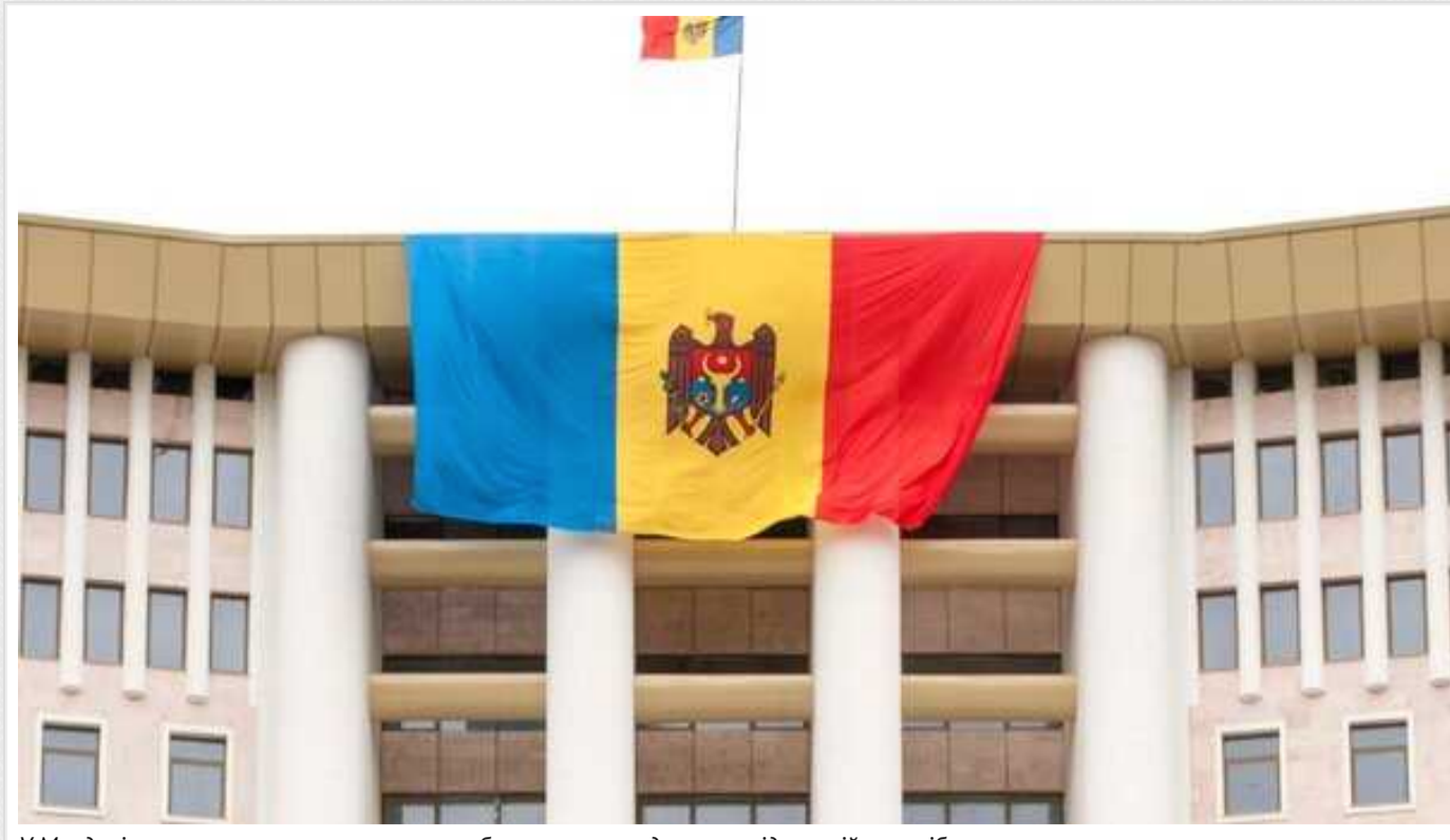
У Молдові схвалили законопроект про позбавлення громадянства підсанкційних осіб

Уряд Молдови у середу схвалив проект закону, який передбачає можливість позбавлення громадянства осіб, які потрапили під міжнародні санкції.