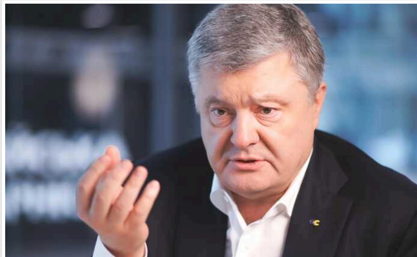
Порошенко закликав німецьку владу припинити фінансування українських чоловіків

П'ятий президент України закликав владу Німеччини замість такого виду підтримки передати ці гроші безпосередньо українській армії.