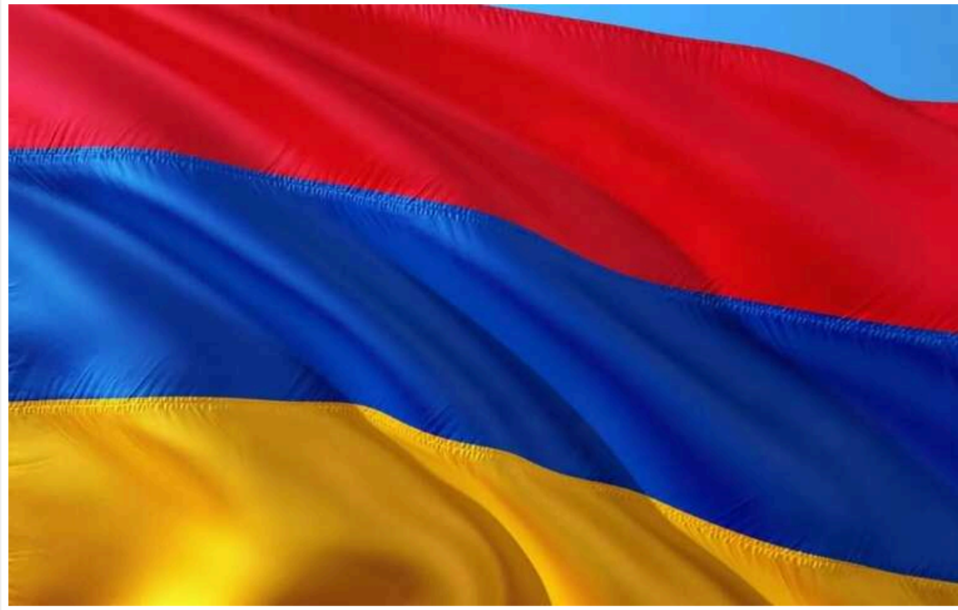
Вірменія відмовилася від фінансування ОДКБ

Вірменія не братиме участі у фінансуванні діяльності Організації Договору про колективну безпеку (ОДКБ), куди також входять Росія та Білорусь.