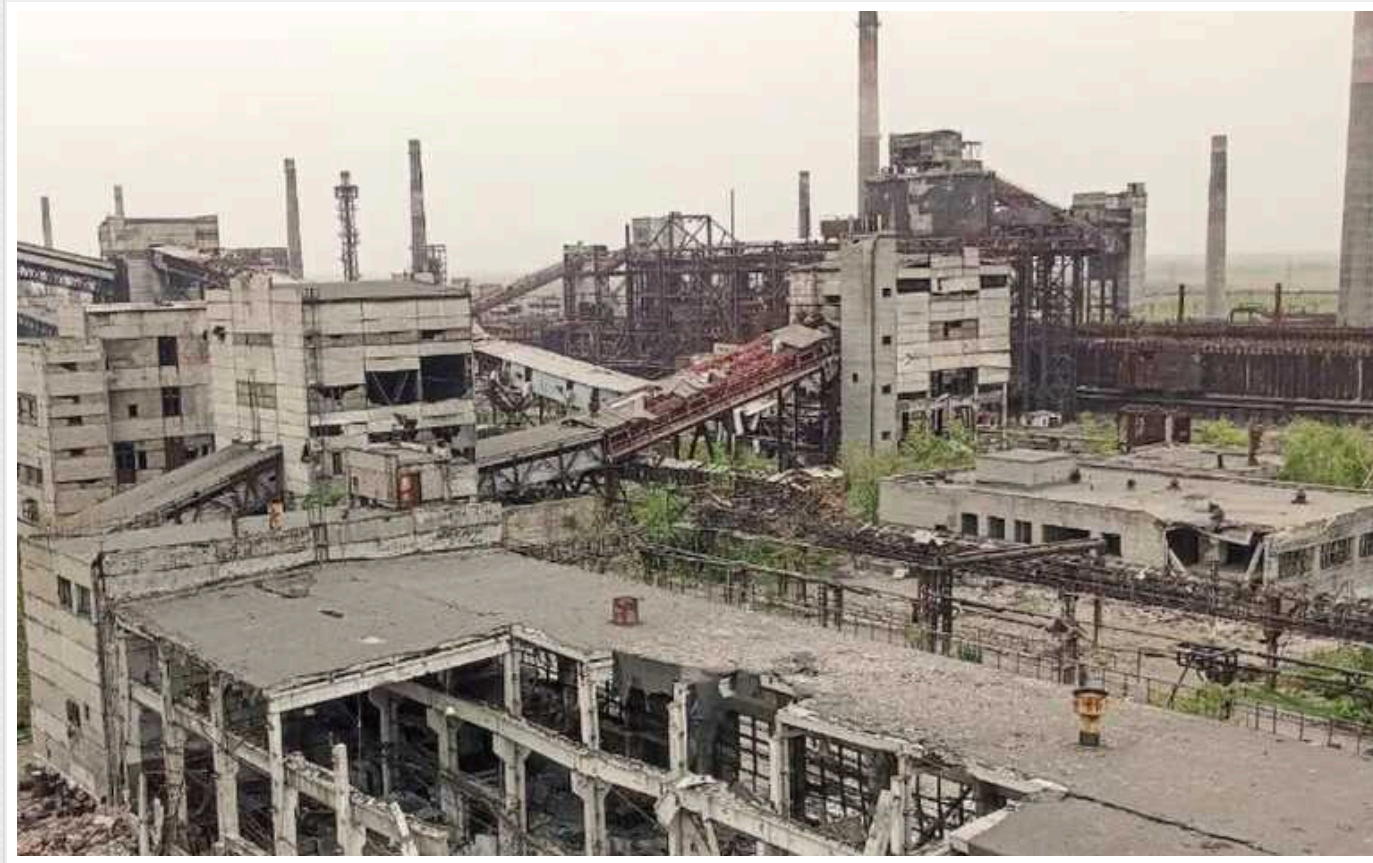
Окупанти придумали, як легалізувати розграбування захопленого Авдіївського коксохіму, – ЦНС

Російські загарбники вивозять вціліле обладнання Авдіївського коксохімічного заводу (АКХЗ) в Авдіївці Донецької області та вже придумали спосіб, як легалізувати розграбування підприємства.