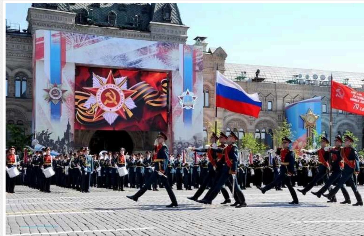
Росіяни в окупованому Бердянську погрожують в'язницею за псування георгіївської стрічки

У тимчасово окупованому Бердянську Запорізької області російські окупанти погрожують штрафами до 5 млн рублів і навіть позбавленням волі за псування георгіївської стрічки. При цьому до категорії "псування" загарбники відносять і носіння стрічки нижче рівня ліктя.