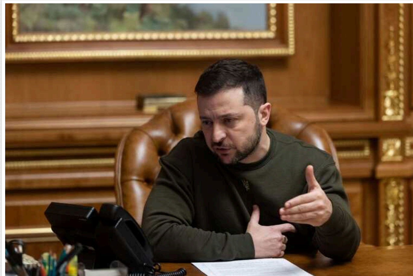
Зеленський провів розмову з Рютте та Шольцом, останні підтвердили участь у Саміті миру

Президент Володимир Зеленський провів телефонні переговори з канцлером Німеччини Олафом Шольцом, а також прем'єр-міністром Нідерландів Марком Рютте.