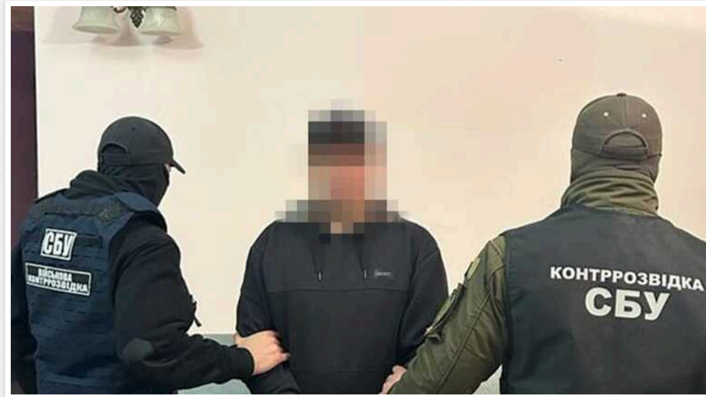
На Миколаївщині засудили агента РФ: "наводив" фосфорні снаряди на область

Агент російської розвідки "наводив" ворожі фосфорні снаряди на Миколаївську область. Зрадник отримав 15 років тюрми.