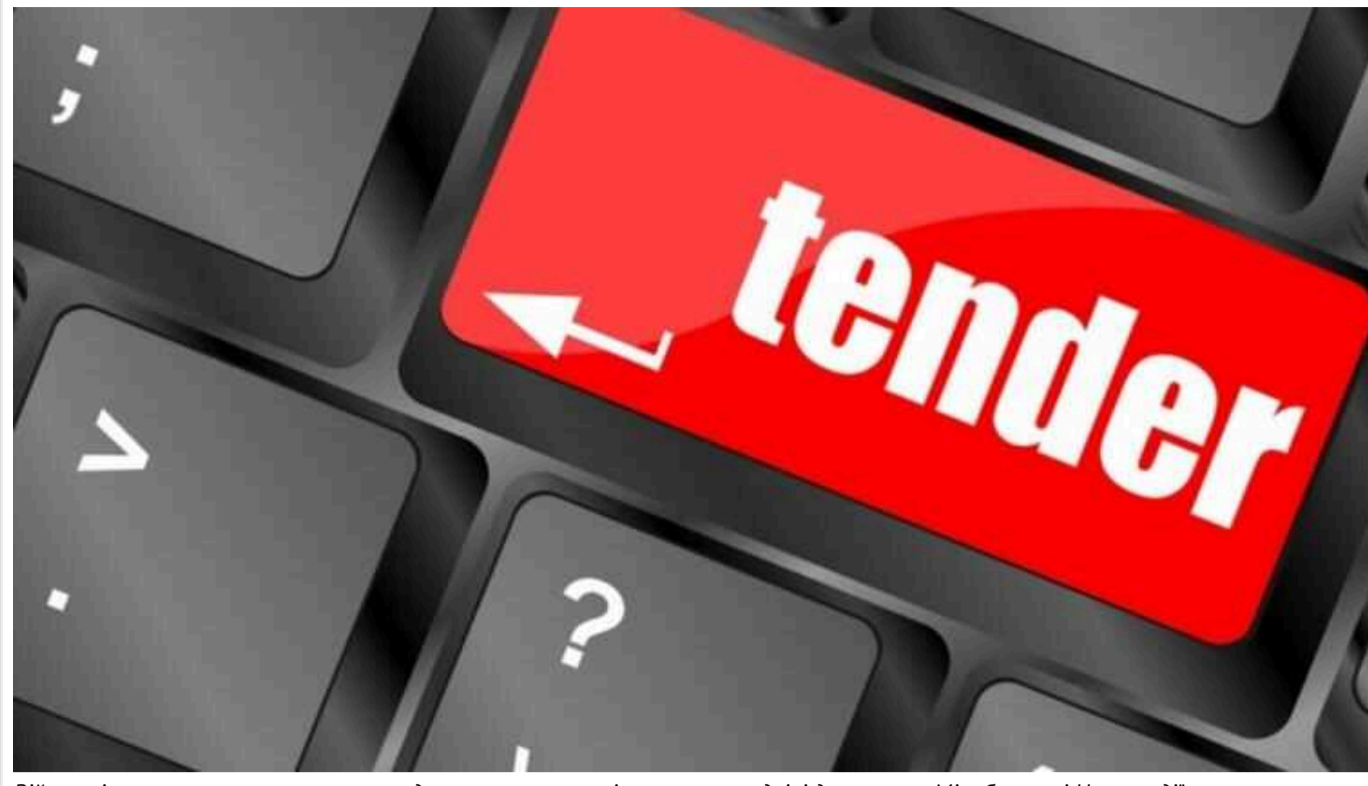
Військові транспортники замовили воду через «екзотичні» «заточки» вдвічі дорожче за Міноборони і Нацгвардії

Військова частина Т0910 Держспецтрансспорту (м. Червоноград, Львівська обл.) 12 квітня за результатами тендеру уклала угоду з ТОВ «Волинська виробнича компанія» про постачання бутильованої питної води на 9,53 млн грн.