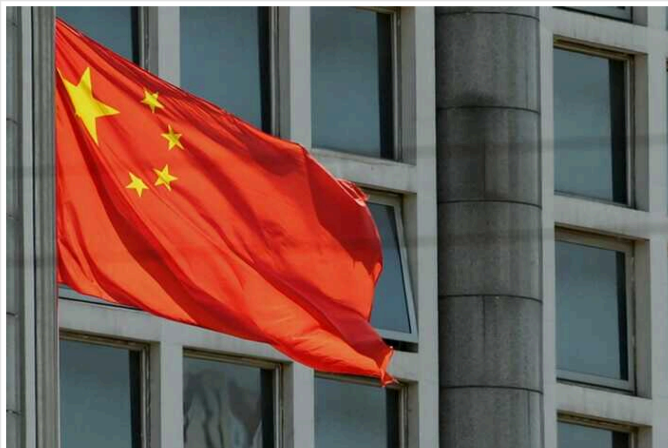
Чим небезпечний бойовий підводний дрон 300СВ: підірве ворогів Китаю на суші та у воді

Безпілотник здатний нести морські міни та невеликі підводні човни, а також може стріляти легкими торпедами та ракетами.