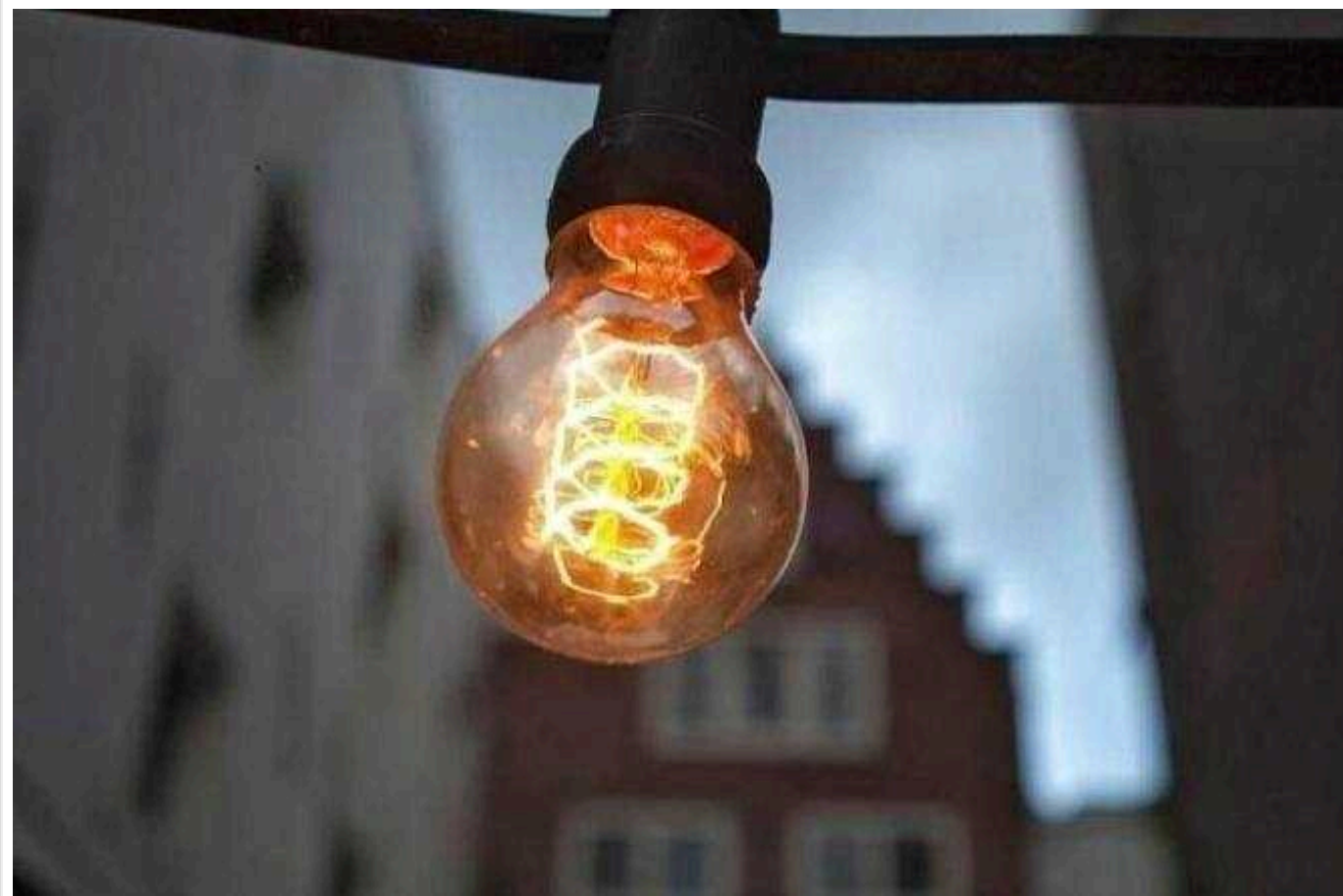
По всій Україні сьогодні можуть запровадити графіки відключення світла

В Україні в середу, 8 травня, можуть запровадити графіки відключення світла. Найскладніша ситуація очікується в енергосистемі з 18:00.