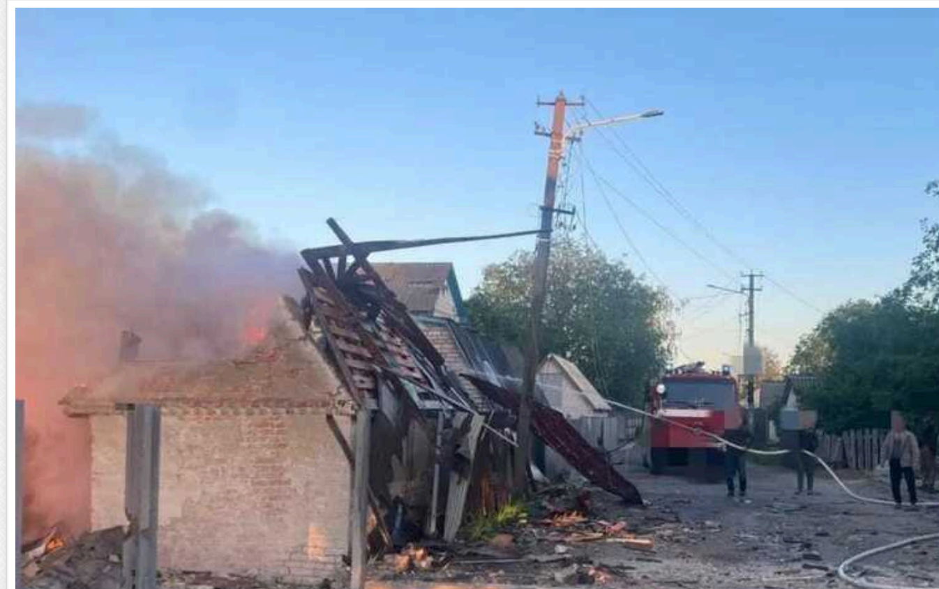
В Мережі показали фото і відео наслідків ворожої атаки на Київщину: над зруйнованою будівлею підіймався дим

Вранці середи, 8 травня, країна-терорист РФ атакувала Київську область за допомогою ракет з літаків Ту-95МС. Силами ППО усі ворожі об'єкти були знищені, проте внаслідок падіння уламків було знищено та пошкоджено 14 приватних будівель, є постраждалі.