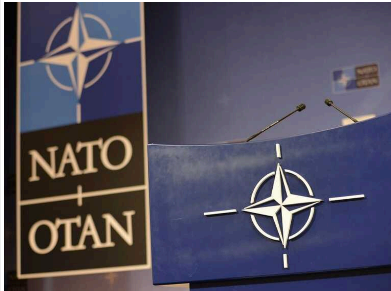
НАТО не планує відправляти війська до України: на липневому саміті буде підписано декларацію

Видання Corriere della Sera повідомляє, що НАТО не відправлятиме війська в Україну.