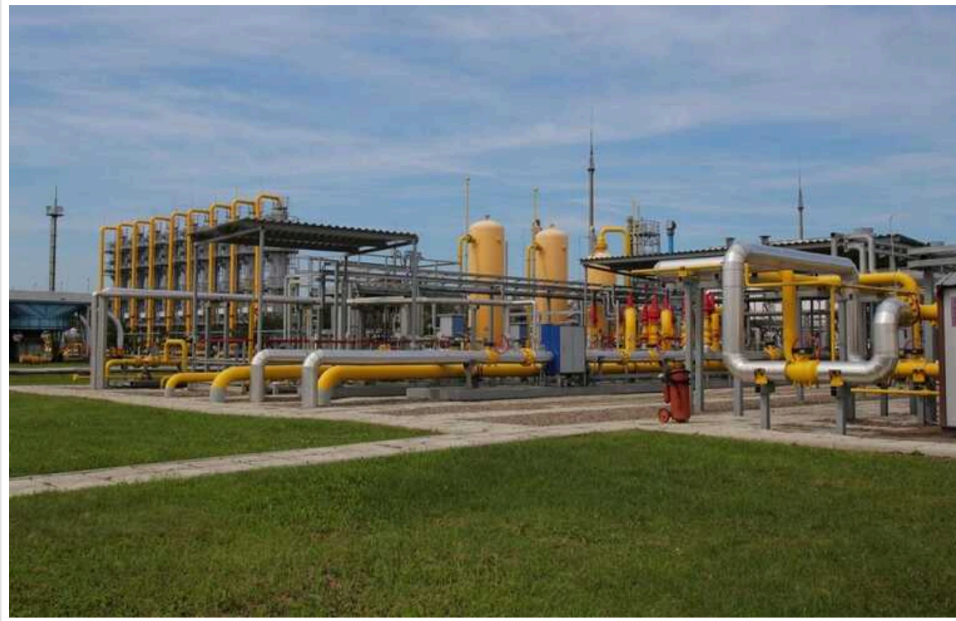
У Львівській області було атаковано підземне газове сховище у Стрийському районі

Голова ОВА Максим Козицький повідомляє, що у Львівській області було вкотре атаковано підземне газове сховище у Стрийському районі.