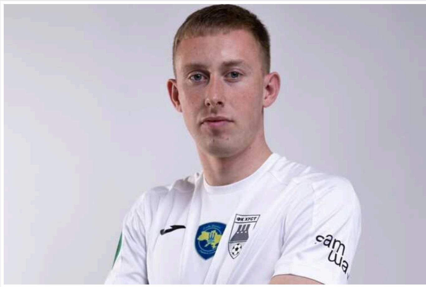
ТЦК мобілізував одного з основних гравців ФК «Хуст»

У футбольному клубі "Хуст" повідомляють, що військкомми мобілізували одного із основних гравців команди.