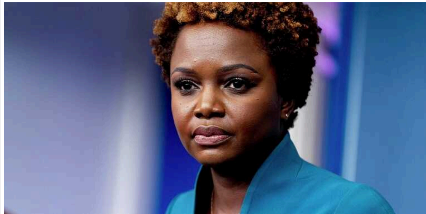
У Білому домі відреагували на спробу замаху на Зеленського

Затримання двох полковників Управління державної охорони, які готували вбивство Президента України – це тривожні новини. Про це заявила речниця Білого дому Карін Жан П'єр під час брифінгу у вівторок, 7 травня.