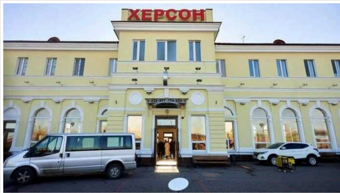
Окупанти вдарили по вокзалу Херсона: у графіку поїздів є зміни

Вранці 8 травня Росія атакувала цивільну залізничну інфраструктуру у Херсоні. Внаслідок ворожих ударів пошкоджено колії та вокзал міста.